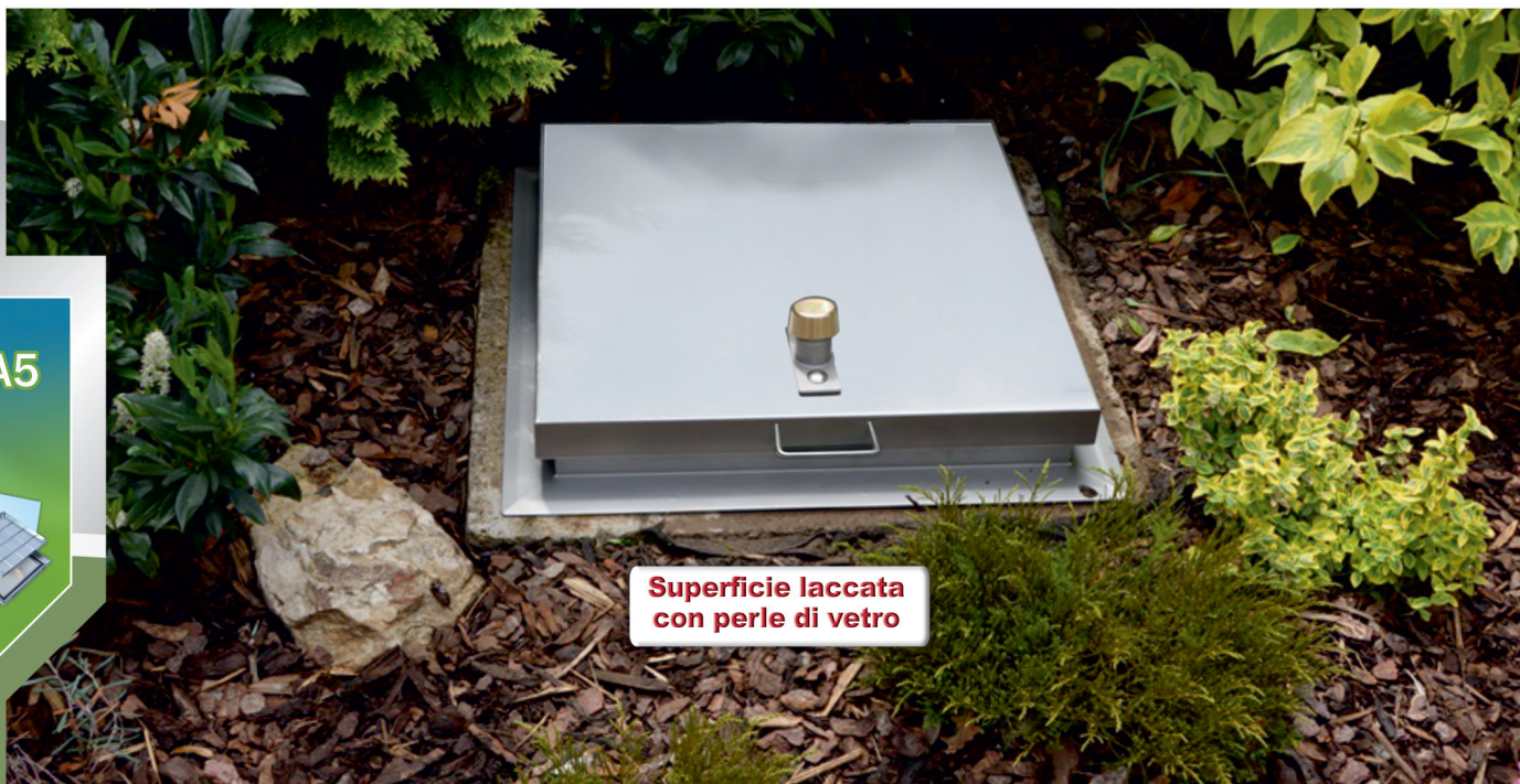
Superficie laccata con perle di vetro